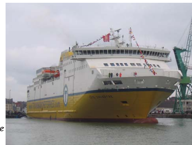
Arrivée du transmanche à Dieppe Photo : Dieppe-Maritime.