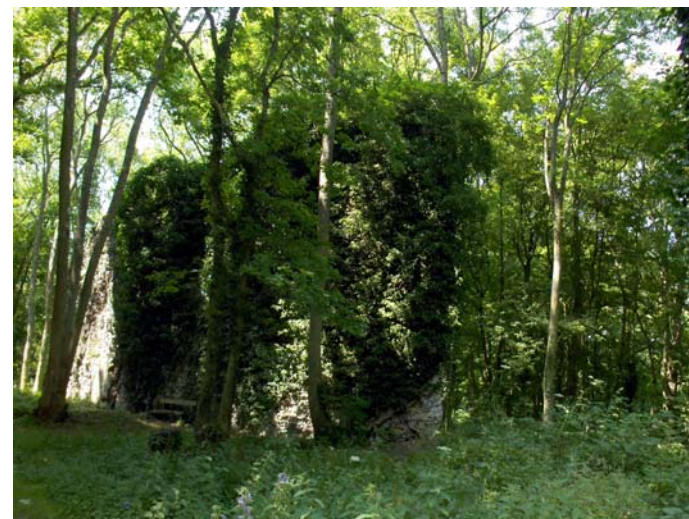
Le bois des communes

Pour la protection des zones sensibles, l'agglomération de Dieppe a compétence en matière de protection des zones sensibles d'intérêt écologique. Elle peut développer des actions de sensibilisation, de préservation, et de mise en valeur (par le tourisme vert par exemple).