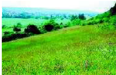
Les coteaux calcaires, des milieux riches à préserver.