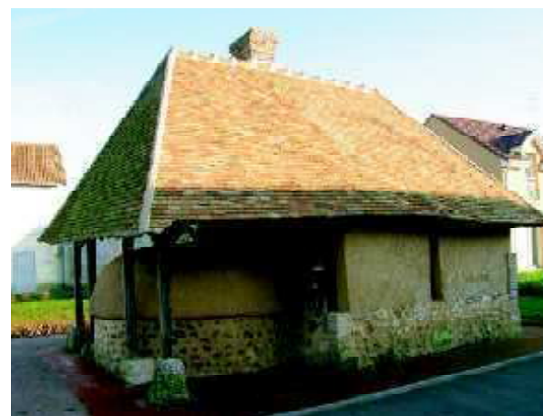
Le petit patrimoine est quelquefois reconstruit, comme ce four à pain à La Haye-Malherbe