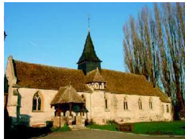
Le patrimoine bâti mérite d'être préservé.

Cartographie : AREHN, janvier 2004