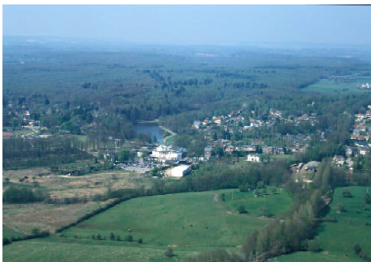
Le Casino de Forges-les-Eaux est un important employeur du Pays de Bray.

Le taux d'emploi du Pays de Bray est de 0,86. On définit ce taux comme le rapport entre le nombre d'emplois sur le territoire, et le nombre d'actifs ayant un emploi et habitant sur le territoire. Si ce rapport est supérieur à 1, cela indique que la zone est attractive en termes d'emploi. S'il est inférieur à 1 comme dans le Pays de Bray, les actifs résidant dans la zone et travaillant à l'extérieur sont plus nombreux que les personnes extérieures à la zone venant y travailler.