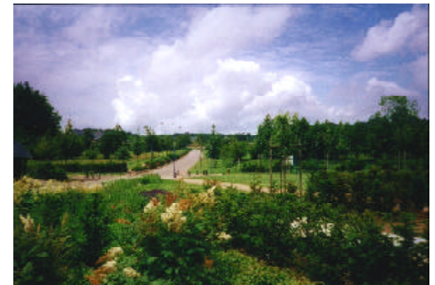
Une belle collection d'arbres fruitiers se trouve au Jardin des plantes de la Ville de Rouen.