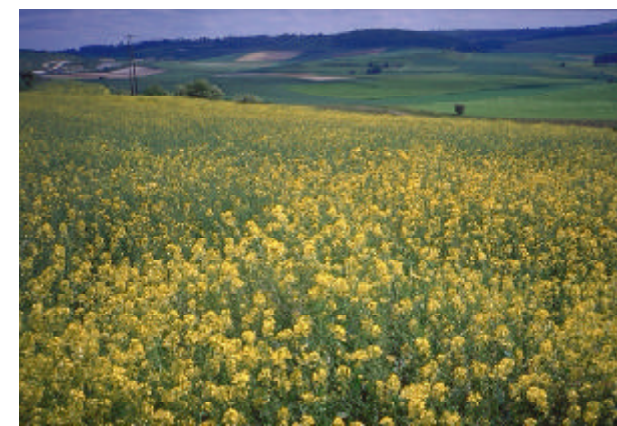
Le colza, matière première végétale pour la production de biocarburants.