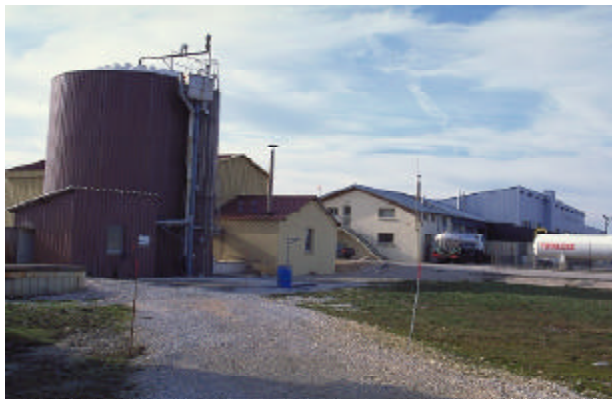
Méthanisation en coopérative agricole.