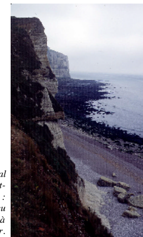
Le littoral haut-normand : un milieu fragile à préserver.

Il arrive également qu'une collectivité locale et une association de protection de la nature se partagent la res-