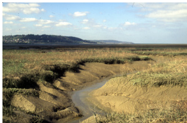
La ZICO de l'estuaire de la Seine représente une superficie de 22 027 ha.