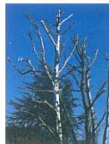
On voit trop d'arbres massacrés...

ques... à moins qu'il ne reste sans réaction mais défiguré. Cela dit, la taille peut se révéler positive si elle vise à rajeunir l'arbre et à prévenir la chute de branches. Elle consiste alors à ôter le bois mort, alléger les charpentières (grosses branches) de l'arbre, réduire la couronne de manière équilibrée, supprimer quelques branches gênantes. C'est ce qu'on appelle l'« élagage doux ». En dehors de cela, laissez vos arbres