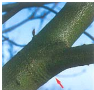
Coupez juste au-dessus du bourrelet visible au niveau de l'empatement.

Vous pouvez pratiquer vous même un élagage léger à tout moment