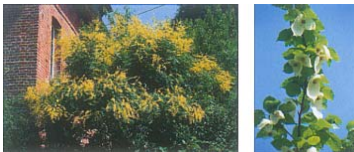
Deux essences de taille réduite à découvrir : le savonnier (à g.), l'arbre aux pochettes (à dr.).

Peupliers même jeunes : chute de branches.