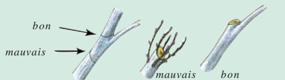
Couper au niveau d'un tire-sève évite l'apparition d'un chicot avec multiples rameaux.

D'après J. Chaïb et J.-P. Thorez, Ecocitoyen au quotidien, Sang de la terre, 2000.