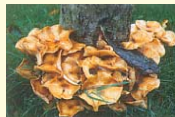
Armillaires au pied d'un pommier : l'arbre est condamné.