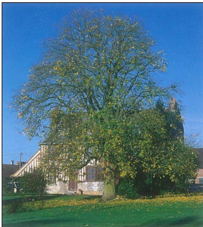
Un patrimoine : vieux frêne à fleurs.

D'apparence solide, les arbres sont sensibles aux agressions qu'ils subissent, ou, plus précisément, que nous leur faisons subir. D'abord, si nous les choisissons mal, ils ne seront pas adaptés au sol et au climat. Ils pousseront mal, et mourront prématurément. Le dénouement sera le même si nous les intoxiquons avec du désherbant ou du sel de déneigement. Enfin, si nous les taillons à mauvais escient, blessons leur tronc ou leurs racines, ils seront la proie de champignons lignivores (« mangeurs de bois ») et dépériront à plus ou moins long terme.