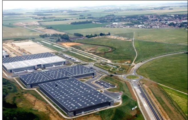
Le parc d'activités de Chanteloup à Moissy-Cramayel (entreprise Prologis, 22 juin 2006).